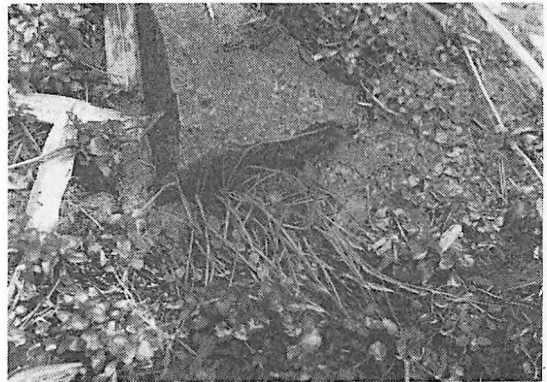
図2 水辺に生育するミズニラとミズユキノシタ (1988年5月31日 図1のNo.2の池)